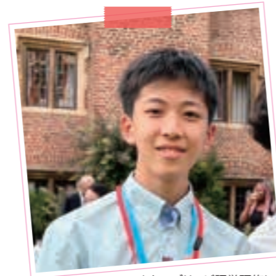
▲ケンブリッジ語学研修にて