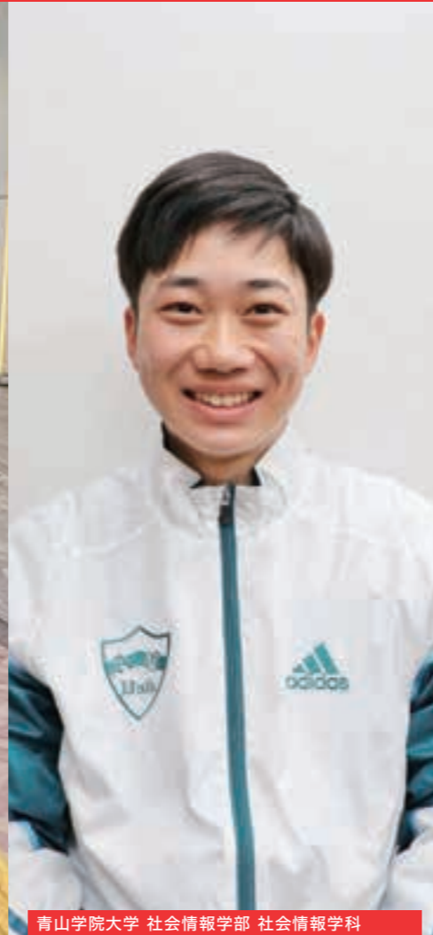
青山学院大学 社会情報学部 社会情報学科