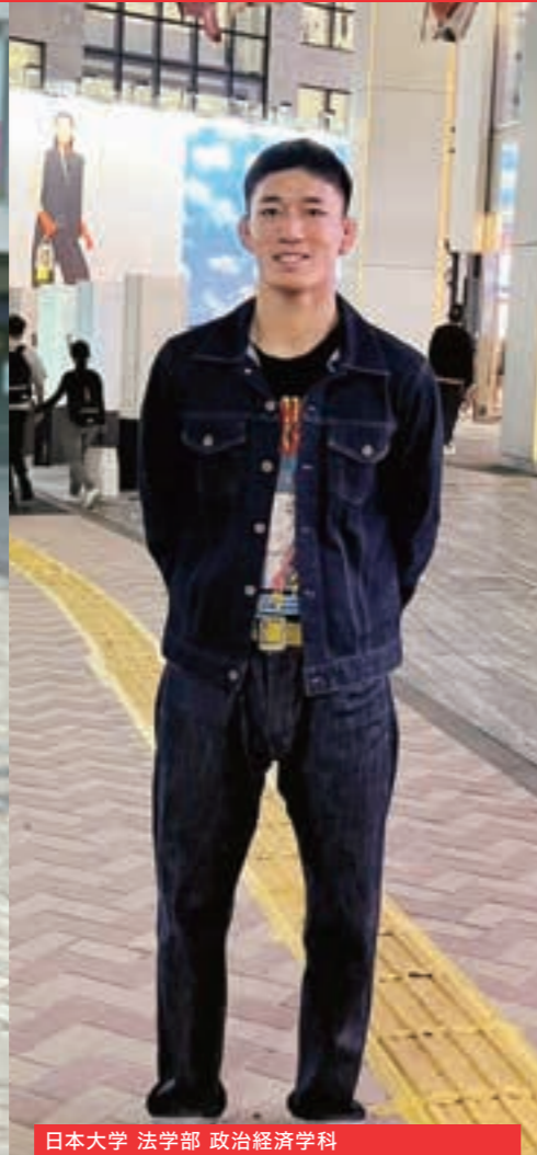
日本大学 法学部 政治経済学科