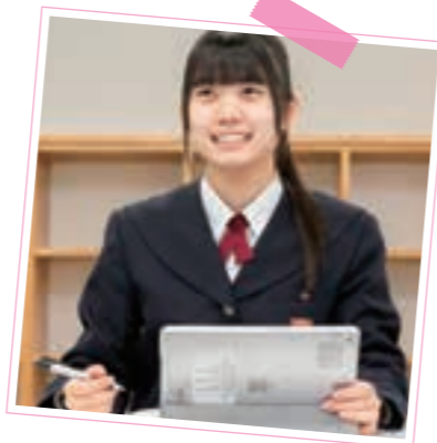
▲チャイアレーティングの仲間

授業では、基礎学力を定着させるために教科担当の先生が教科書の内容を分かりやすく丁寧に指導してくれます。また、わからないことは生徒同士で教えあい、仲間とのコミュニケーションが活発で楽しい雰囲気です。文武両道を目指すコースであり、部活動では個人やチームの目標に向かって一生懸命練習に取り組み、自分自身を成長させることができます。