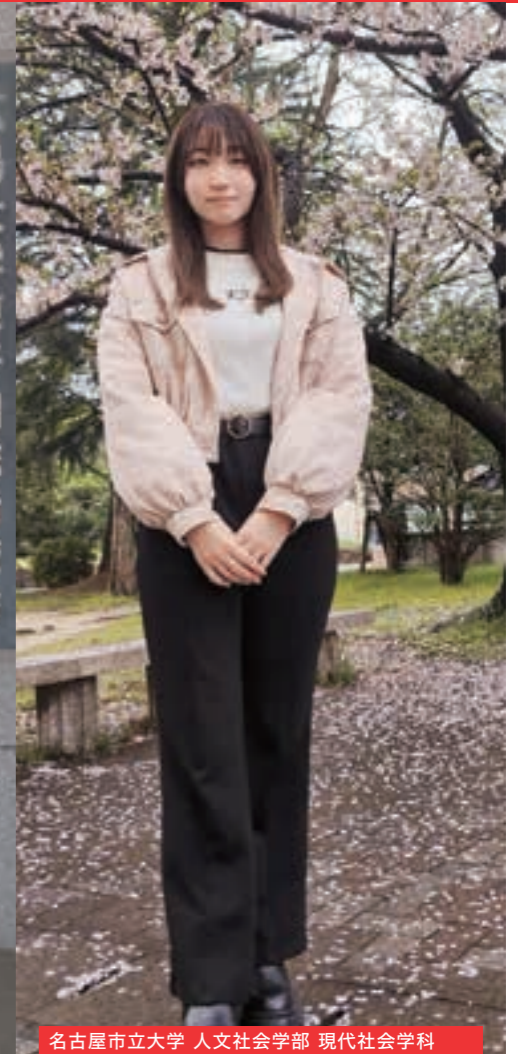
名古屋市立大学 人文社会学部 現代社会学科