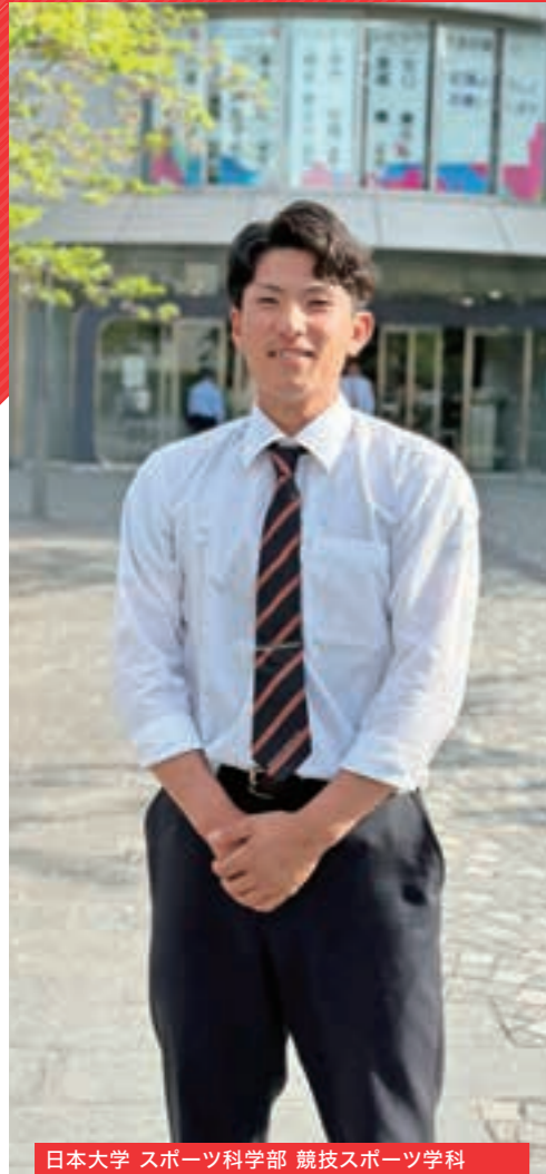
日本大学 スポーツ科学部 競技スポーツ学科

大垣日大での学びをもとに多彩な分野で活躍する卒業生たち。 高校生活の思い出や大垣日大の魅力を教えてくださいました。