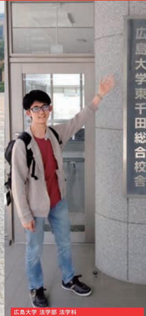
広島大学 法学部 法学科