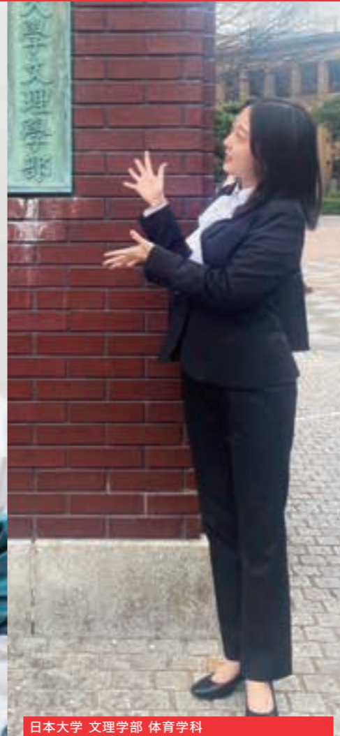
日本大学 文理学部 体育学科